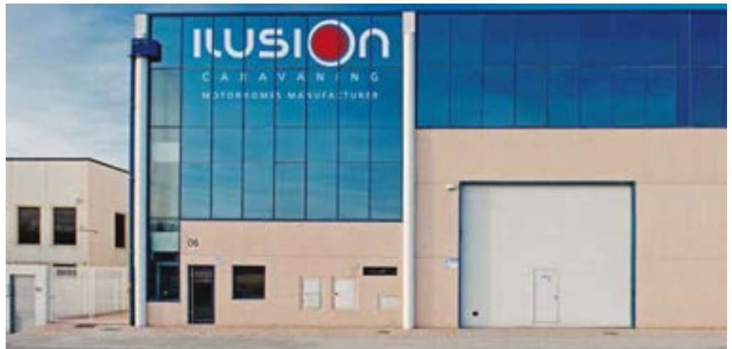
Exterior de las instalaciones fabriles de Ilusion en Zaragoza.

Los vehículos se fabrican en una línea de producción moderna y equipada con las tecnologías más actuales.